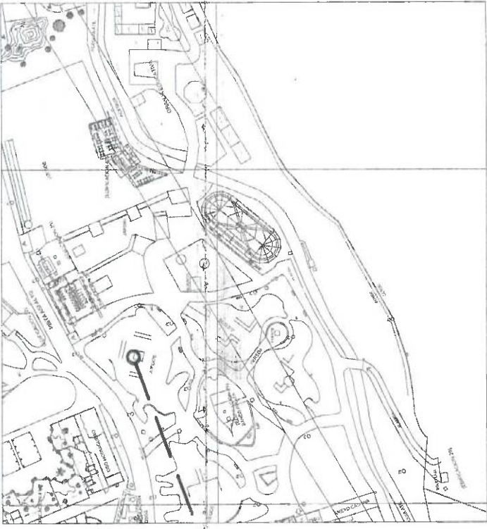
PLANO DE LOCALIZACION ESCALA: SIE